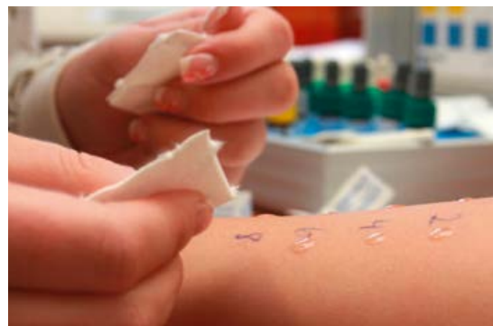
Beim Pricktest werden verschiedene allergene Flüssigkeiten auf die angeritzte Haut aufgetropft. Bilden sich Quaddeln oder rötet sich die Haut, kann der Arzt die Allergie erkennen.

Mit speziellen Hauttests, so genannten Prick- oder Scratchtests, findet der Hautarzt heraus, welche Pollen die allergischen Symptome auslösen. Winzige